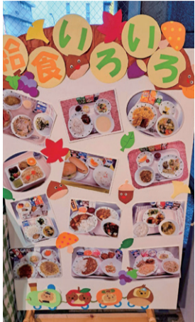
区役所の給食展示より

10月1日より、杉並区でも区立小・中・特別支援学校の給食費無償化がスタートしました。物価高騰が深刻化するなか、保護者から歓迎の声が寄せられています。