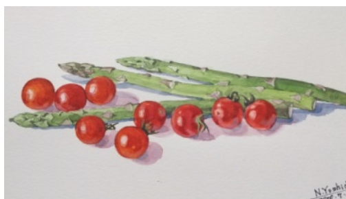
吉田信夫画 「アスパラとミニトマト」