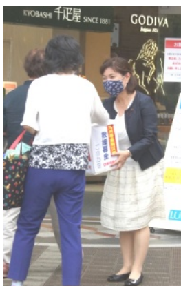
荻窪駅北口(上2枚) 荻窪駅南口(右下)

多くのおみなさんからのご協力で感謝申し上げます。お預かりした募金は、党対策本部を通じて、被災地に送りました。募金は、左記の郵便振り込みでも受け付けておりますので、引き続きのご協力をよろしく願います。