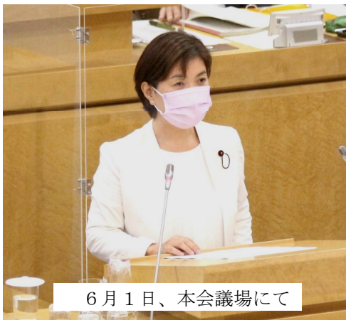
6月1日、本会議場にて

憲法25条の「生存権」の理念に基づく生活保護制度は、最後のセーフティネットともいわれていますが、日本では、生活保護は恥という風潮やバッシングの横行、制度が正確に知らされていない等のために、保護率が低いことが問題となっています。私は、生活保護を申請しやすくするために、厚労省や他自治