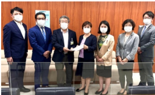
(上) 5月6日、副区長に、給食費値上げ撤回を申し入れました。 (右) 申し入れ書

杉並区は、原材料等の価格上昇を理由に、4月から学校給食費を保護者負担により値上げしました。20区は値上げせず、1区は一部値上げです。（左表） 政府・文科省は、交付金を活用し、給食費を軽減するよう通知しましたが、杉並区は無視しました。 日本共産党杉並区議団は、5月6日、区に対し、保護者負担による値上決定を撤回するよう申し入れを行うとともに、5月23日の区議会一般質問で野垣あきこ区議が、国の交付金も活用し、給食費軽減を検討するよう迫りました。区教育委員会は「交付金の活用も視野に」「方策を検討していく」と答弁しました。